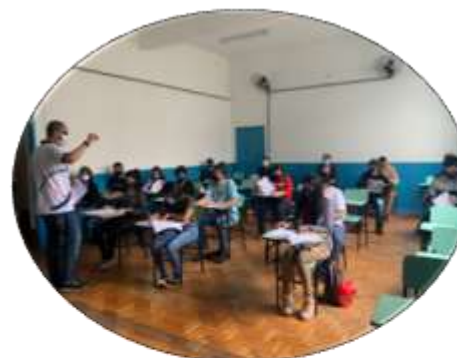
Centro Oportunizar - Seleção de Jovem Aprendiz