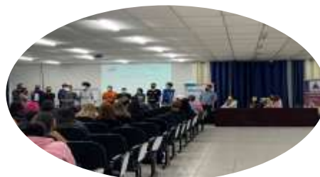
Lançamento do Pré-Enem (Abril)

026/22 – Pré-Enem (Pré-Vestibular Social)