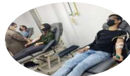
Universitário Sangue Bom 1 (Abril)