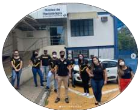
Universitário Sangue Bom 2021