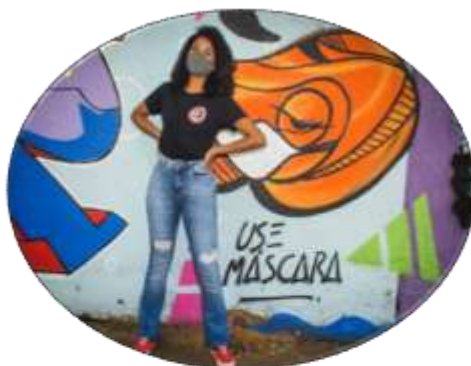
Se Liga Juventude