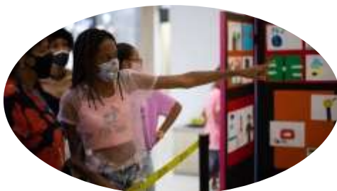
Mapa dos Sonhos (Março)