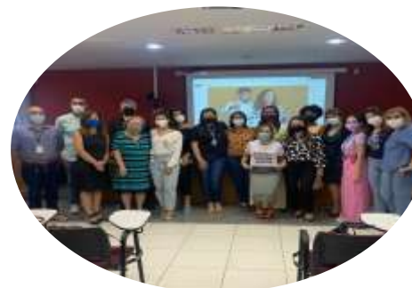
Fluxo de Aprendizagem (Abril)