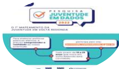
Juventude em Dados (Janeiro)