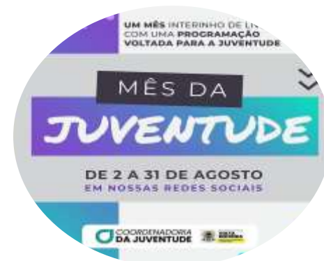
Mês da Juventude